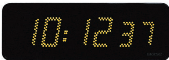
Style 12 S